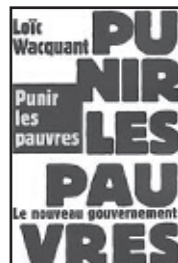
« Punir les pauvres, de l'Etat social à l'Etat pénal » de Loïc Wacquant, 2004, Agone, 347 p.

ressorts de la « pensée unique sécuritaire » qui sévit aujourd'hui partout en Europe, ce livre pointe les voies possibles d'une mobilisation civique visant à sortir du programme répressif qui utilise la prison comme d'un aspirateur social chargé de faire disparaître les rebuts de la société de marché.