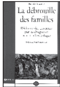
« La débrouille des familles - Récits de vies traversées par les drogues et les conduites à risque » de Pascale Jamouille. De Boeck, Coll. Oxalis, 230 pages, 2009